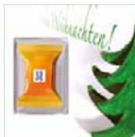
Motiv-Nr.: 92545 - Holzbaum