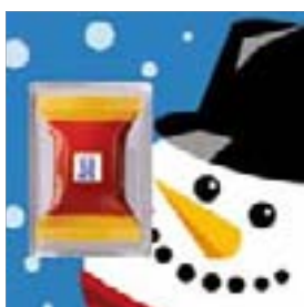
Motiv-Nr.: 92592 - Snowman