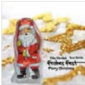
Motiv-Nr.: 92576 - Goldsterne