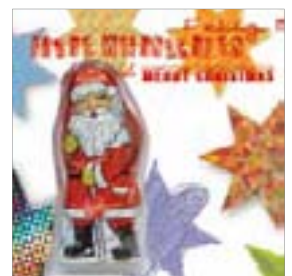
Motiv-Nr.: 92602 - Stars