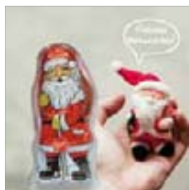
Motiv-Nr.: 92549 - Plüschnikolaus