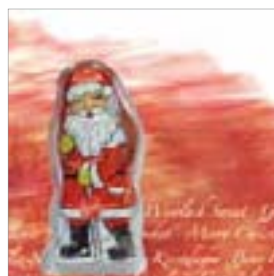
Motiv-Nr.: 92600 - International Christmas