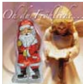
Motiv-Nr.: 92550 - Oh du Fröhliche ...