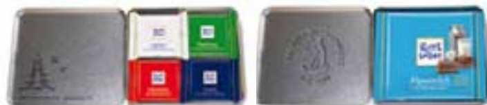
Ritter SPORT Minis