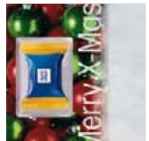
Motiv-Nr.: 92580 - Kugelspiel