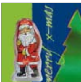
Motiv-Nr.: 92547 - Baum auf Blau