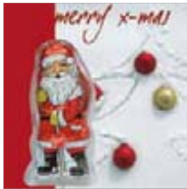
Motiv-Nr.: 92546 - Rot und Gold im Schnee