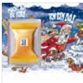
Motiv-Nr.: 92535 - Kling, Glöckchen, kling!