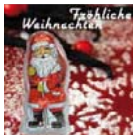
Motiv-Nr.: 92560 - Puderzucker