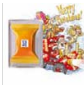
Motiv-Nr.: 92533 - Hoch auf dem roten Wagen