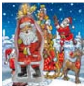
Motiv-Nr.: 92508 - Päckchen-Turm