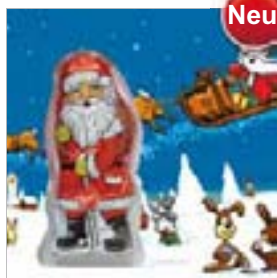
Motiv-Nr.: 92632 - Fliegende Elche

B Ihr Logo, Ihr Text oder Ihr Bild wie gewünscht platzieren, evtl. das Motiv farblich verändern. Fertig!