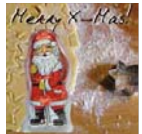
Motiv-Nr.: 92613 - Stern-Plätzchen