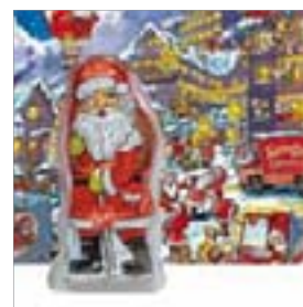
Motiv-Nr.: 92515 - Citylights