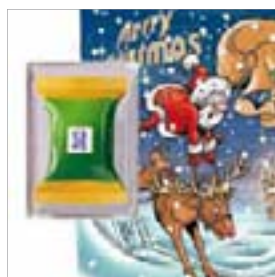
Motiv-Nr.: 92513 - Rentier-Rodeo