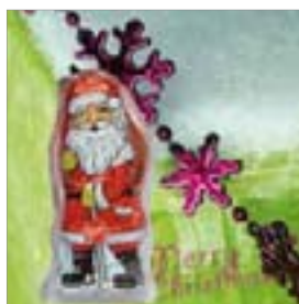
Motiv-Nr.: 92542 - Lila Schneekristalle