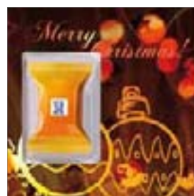
Motiv-Nr.: 92596 - Gezeichnete Kugeln