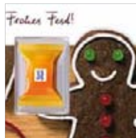
Motiv-Nr.: 92572 - Lebkuchenzeit