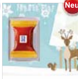
Motiv-Nr.: 92630 - Weihnachtsreh