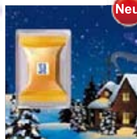
Motiv-Nr.: 92629 - Blockhaus