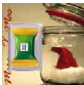
Motiv-Nr.: 92564 - Mütze im Glas