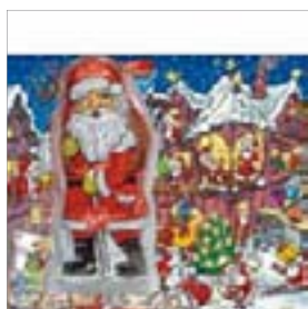
Motiv-Nr.: 92514 - Time for a break