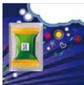
Motiv-Nr.: 92594 - Christmas Blue