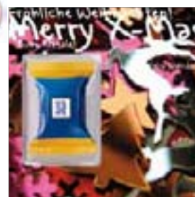
Motiv-Nr.: 92540 - Glitzerfiguren