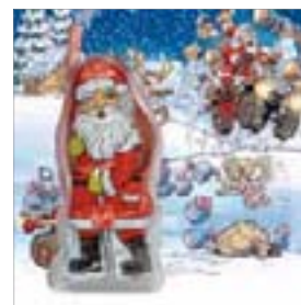
Motiv-Nr.: 92506 - Stürmische Weihnachten