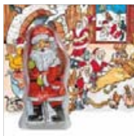
Motiv-Nr.: 92523 - Backstube