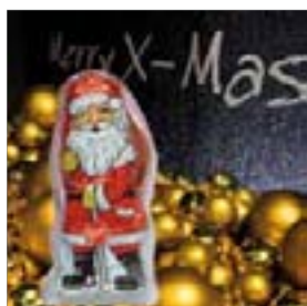
Motiv-Nr.: 92562 - Glänzende Kugeln