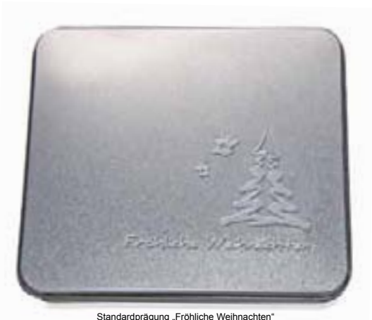
Standardprägung „Fröhliche Weihnachten“

Ca. 15 Arbeitstage nach Druck- bzw. Korrektur-/Musterfreigabe.