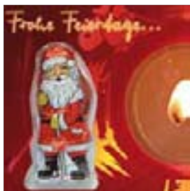
Motiv-Nr.: 92611 - Kerzenstimmung