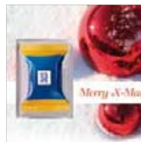
Motiv-Nr.: 92618 - Rote Kugeln