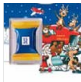
Motiv-Nr.: 92522 - Christmas Check-in