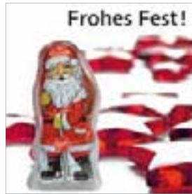
Motiv-Nr.: 92589 - Glassterne