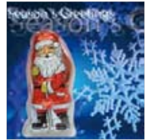
Motiv-Nr.: 92615 - Winterkälte