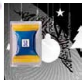
Motiv-Nr.: 92593 - X-Mas Anhänger