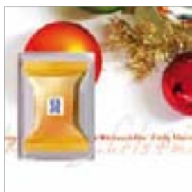
Motiv-Nr.: 92561 - Kugeln & Girlande