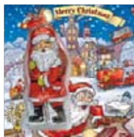
Motiv-Nr.: 92510 - Christmas-Hotline