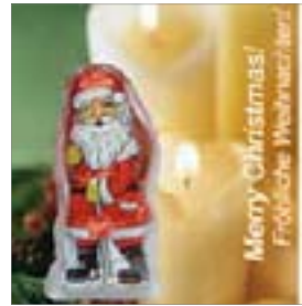
Motiv-Nr.: 92614 - Candlelight