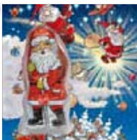
Motiv-Nr.: 92502 - Weltall