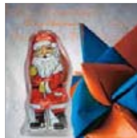
Motiv-Nr.: 92548 - Schleifen-Stern