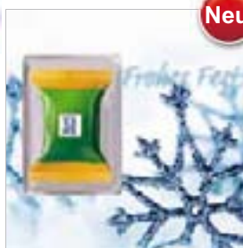
Motiv-Nr.: 92628 - Blaue Kristalle