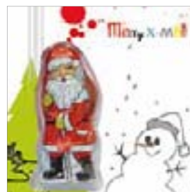
Motiv-Nr.: 92597 - Numbers