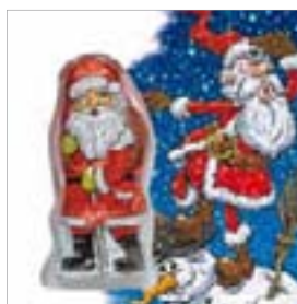
Motiv-Nr.: 92509 - Fest in Sicht