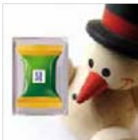
Motiv-Nr.: 92565 - Rote Nase