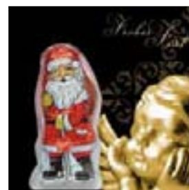
Motiv-Nr.: 92617 - Goldengel