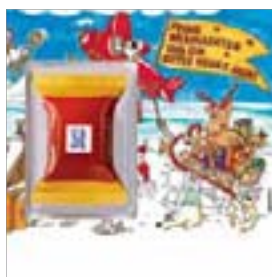
Motiv-Nr.: 92531 - Flugstunde