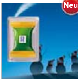
Motiv-Nr.: 92625 - Schneemann-Familie