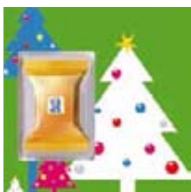
Motiv-Nr.: 92595 - Trees on green