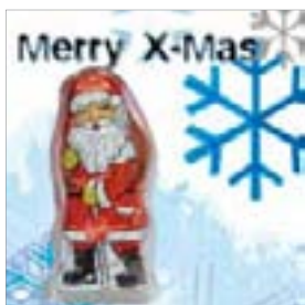
Motiv-Nr.: 92601 - Kristallstimmung