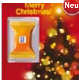
Motiv-Nr.: 92624 - Blurry Christmas