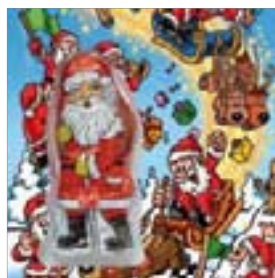
Motiv-Nr.: 92501 - Schlittenrennen