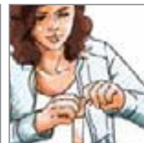
... aufreißen ...