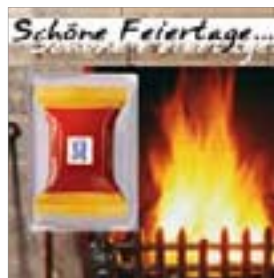
Motiv-Nr.: 92579 - Kaminfeuer