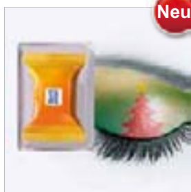
Motiv-Nr.: 92504 - Geschenke-Versand