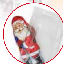
Extra Schutz durch „Frische-Tresor“

B Oder Sie verwenden keine Vorlage und gestalten die Premium-Card komplett individuell.