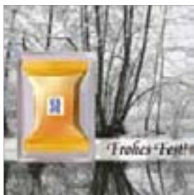
Motiv-Nr.: 92552 - Reflektion