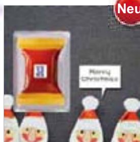
Motiv-Nr.: 92626 - Christmas Jeans