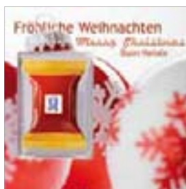
Motiv-Nr.: 92539 - Kugeln rot-weiß