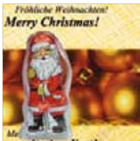
Motiv-Nr.: 92612 - Goldene Kugeln