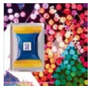
Motiv-Nr.: 92557 - Leuchtender Wald