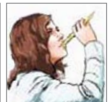
... und genießen!